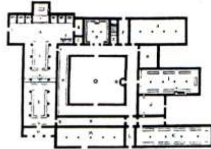
Plan d'un monastère cistercien typique A:église - B:sacristie - C:armarium - D:chapitre E:auditorium - G:scriptorium - H:chauffoire I:réfect. des moines - J:cuisine - K:réfect. des convers - M:cellier - N:pass. des conv. - Q: narthex